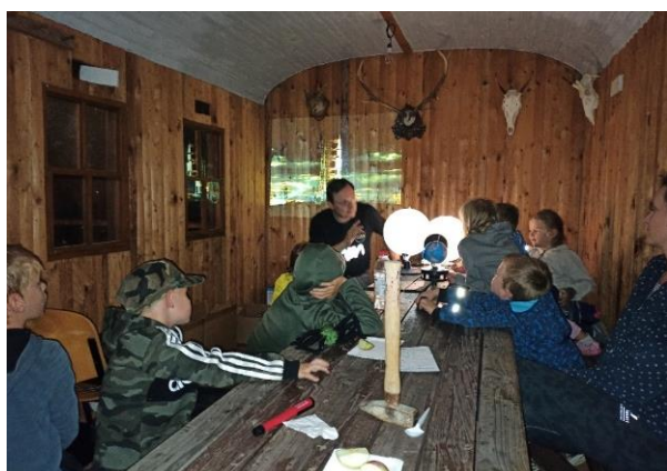
Stanování – povídání o měsíci