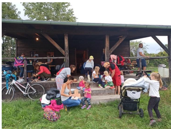
Stanování – sestavování budek a krmítek