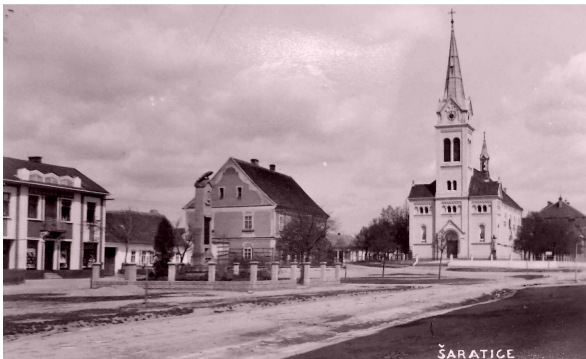
Šaratická návěs v roce 1932. Namísto silnice a chodníku byly jen rozblácené cesty. Z dnešního hlediska je to velmi nepohodlné, ale dýchá z toho poklidná atmosféra...