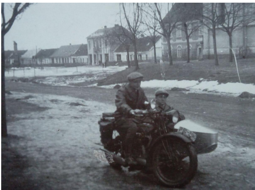
Šaratická návěs v roce 1929, se dvěma mladíky na motorce v popředí